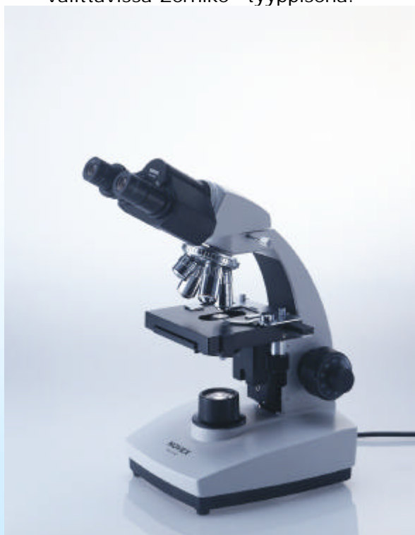
86.425 Faasi Laboratoriomikroskooppi